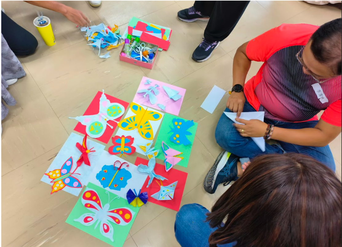
第三組 利用前面提供各種媒材包括毛線、毛根、玻璃紙、氣球、筆或是戶外各種素材，每人製作一隻蝴蝶